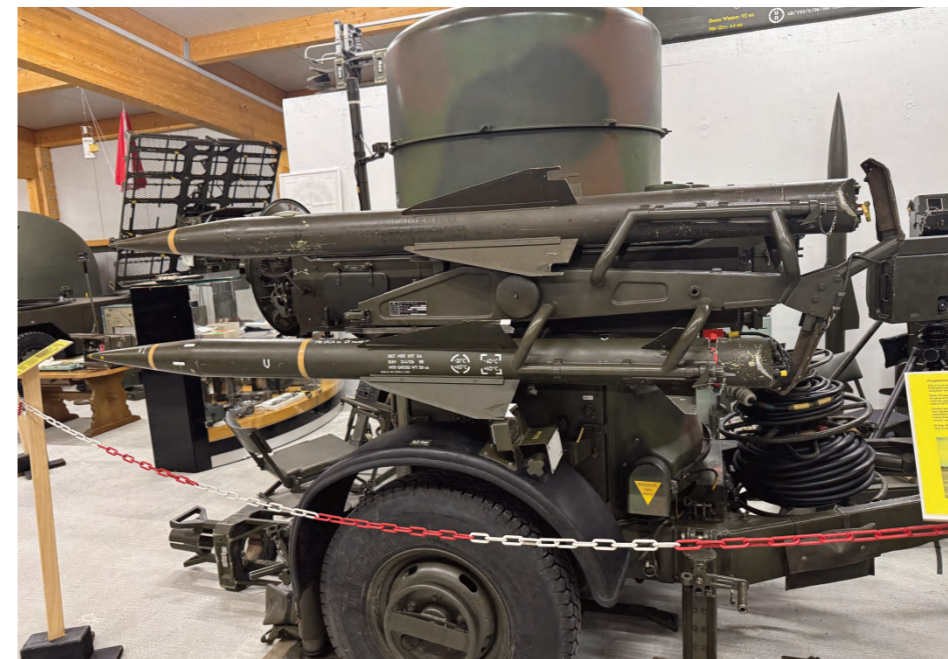
L'arme de défense aérienne Rapier qui a été retirée du service de façon totalement irresponsable. Aujourd'hui rien de la remplace.

voir des affiches de la « collection Diamant », qui incitaient la population à soutenir la défense nationale. À la fin, nous avons récompensé cette visite guidée impressionnante