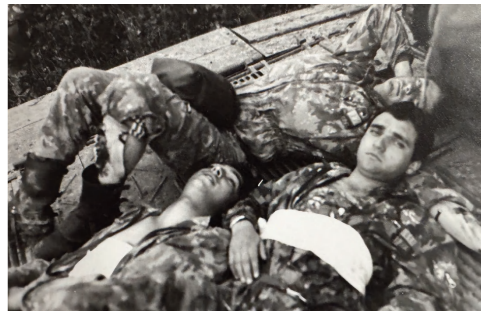
Soldats blessés au cours d'un engagement. En effet, ils ont prêté serment : « Je jure (ou je promets) de servir fidèlement la Confédération suisse, de protéger avec courage les droits et la liberté du peuple suisse, et de remplir mon devoir au prix de ma vie. » Il serait absolument tragique de confondre ce service militaire avec d'autres prestations à la communauté nationale !

La sécurité militaire fait partie de la neutralité et garantit la protection contre les invasions militaires et les risques de guerre, ainsi que la ca-