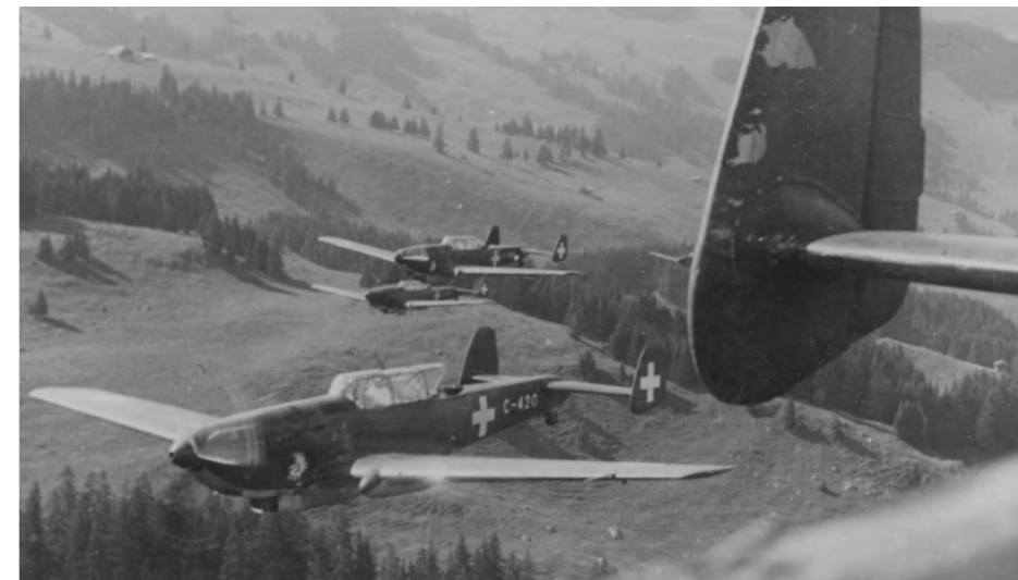
La neutralité armée. Un statut qui fut décidé en 1815 au Congrès de Vienne, en fait cette idée de neutralité remonte à des temps plus anciens. Malgré tout le chambardement d'avant la deuxième guerre mondiale la Suisse s'y est à cette neutralité et fut respectée. L'armée a joué un grand rôle en montrant la volonté populaire et politique.

Cela montre la vacuité du discours. Un phénomène qui touche beaucoup de gens censés réfléchir de façon scientifique, c'est à dire selon